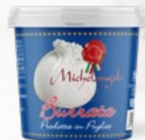
TENDANCE Burrata pot 100g Michelangelo Code 158100