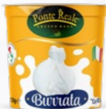
NOUVEAU Burrata pot 125g Code 125128