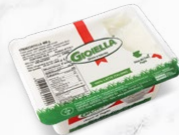
NOUVEAU Stracciatella di Burrata barquette 400g Code 415877