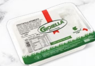
NOUVEAU Stracciatella di Burrata fumée barquette 400g Code 415878