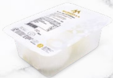
TOP PRODUIT Burrata 4x50g barquette 200g Code 136405